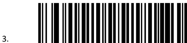
Enable NOTIS Editing